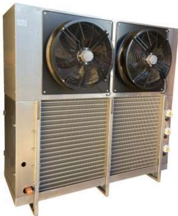
Шокфростер BSL 63.23S